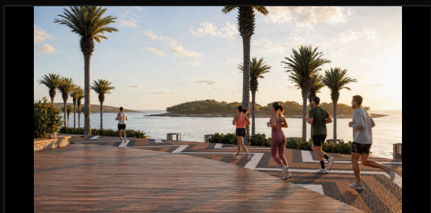
G3 5 CORREDORES · DECK BEIRA D'ÁGUA