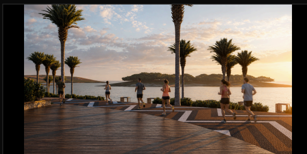
G4 GRUPO · DECK · PÔR DO SOL