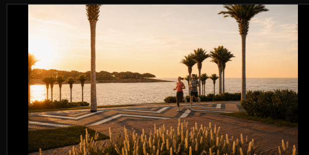
G5 CASAL · ALONGAMENTO · GOLDEN HOUR