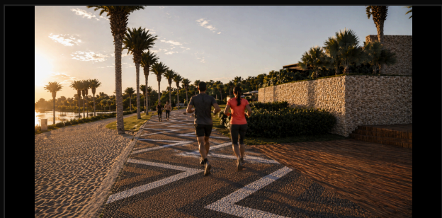
G6 CASAL + GRUPO · CALÇADÃO ZIGUE-ZAGUE