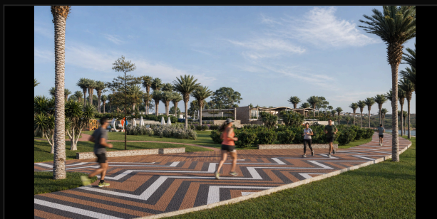
G7 CORREDORES · CALÇADÃO · FOLHAGEM