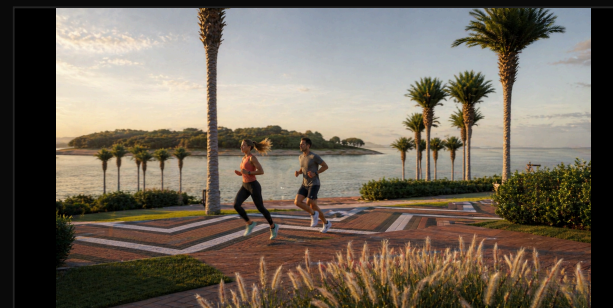
G8 CASAL · GRAMÍNEAS · MARGEM DO LAGO