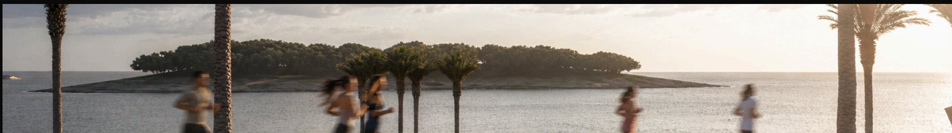
T6 · REFERÊNCIA DO LOOP · GRUPO CORRENDO · MARGEM DO LAGO CORUMBÁ IV

Toalha branca refrescada (não gelada). Replica a temperatura do ar no amanhecer beira-lago. A pele recebe o lugar antes do visitante pisar lá. Memória corporal é ancoragem espacial silenciosa.